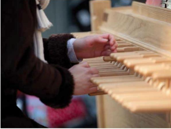
Tekst: Josje Hoppenbrouwers

Benieuwd naar wat jouw buurtgenoten en de ondernemers in de wijk allemaal doen en mee maken? N.U. gaat iedere maand voor jou buurten in de buurt en interviewt bijzondere, inspirerende en boeiende mensen met een verhaal.